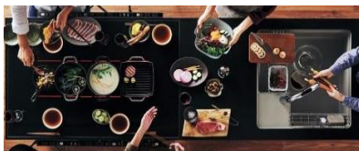
(写真：自由な使い方が楽しめる「対面操作マルチワイドIH ガラステーブルタイプ」)