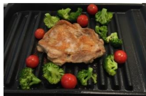
(前回調理例 ：チキングリル)