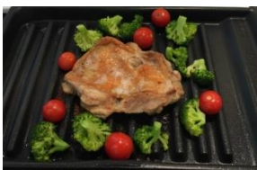
(写真：網無しお手入れ楽々「ラッキングリル」)

PanasonicリフォームClub(株)鋳エスアール工業主催による最新のキッチンで、実際にお料理ができるイベントです。