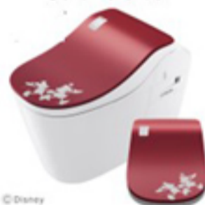
Panasonic アラウノ ミッキーデザイン