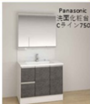
Panasonic 洗面化粧台 Cライン750