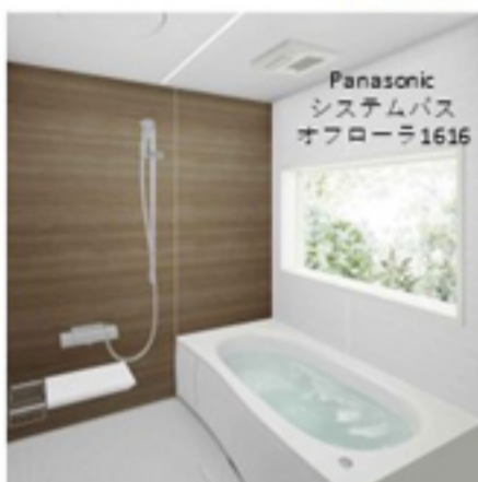
Panasonic システムバス オフロラ1616