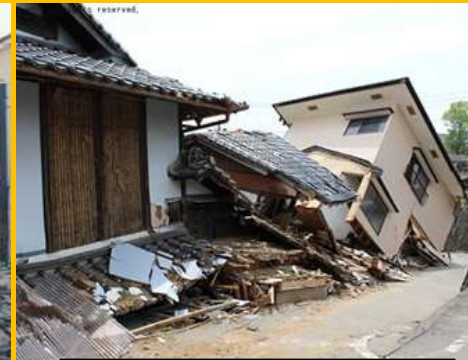
熊本地震で倒壊した建物