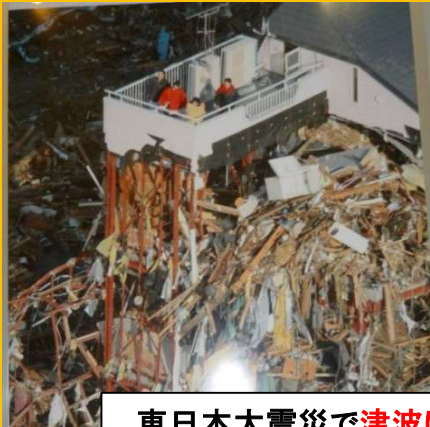
東日本大震災で津波に耐えた重量鉄骨の建物