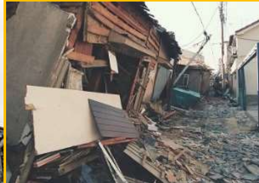
阪神淡路大震災で倒壊した建物