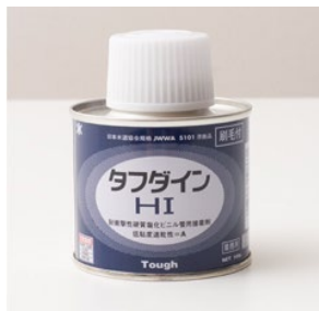
塩ビパイプ用接着剤