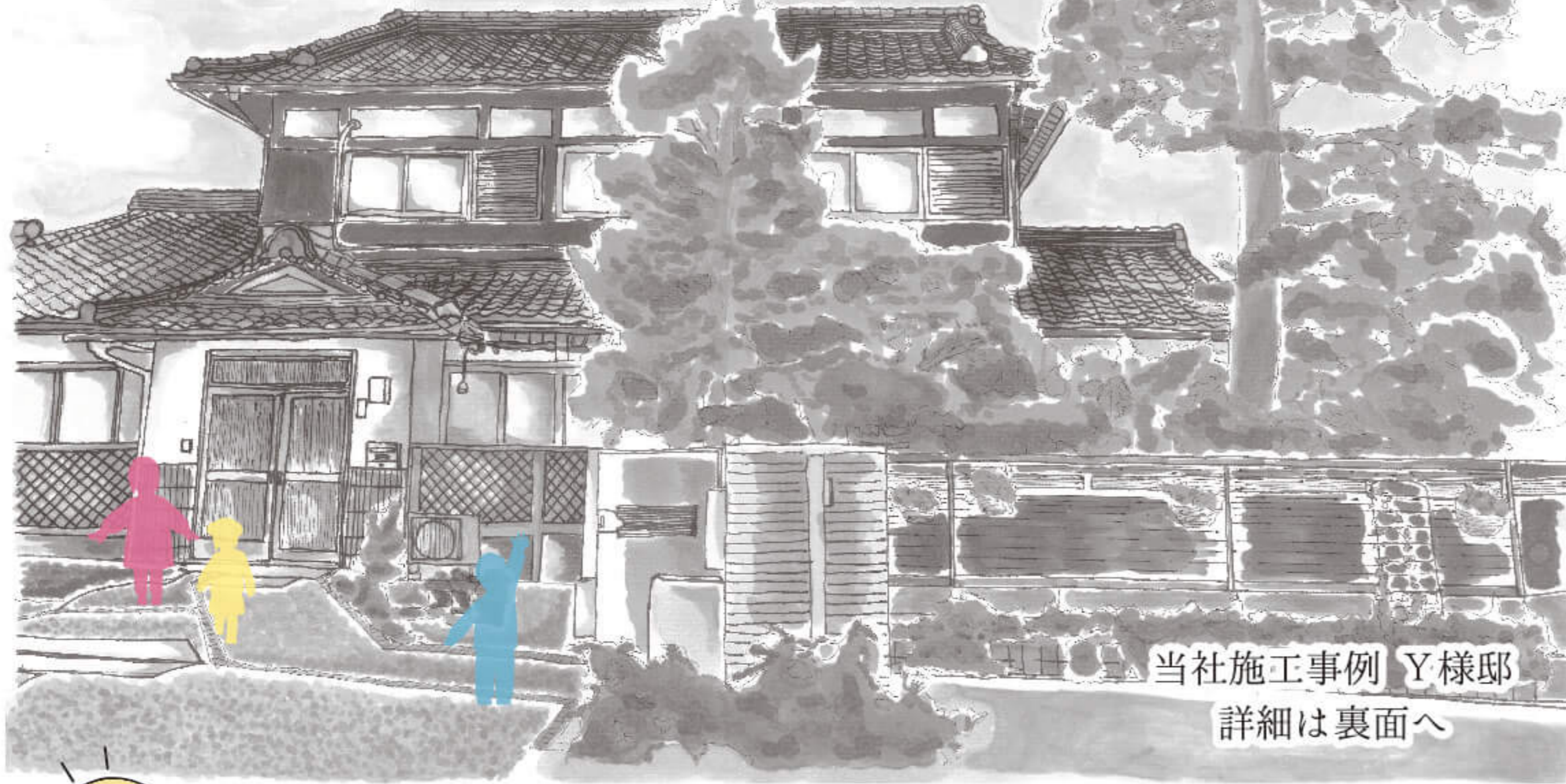
当社施工事例 Y様邸 詳細は裏面へ

ライフスタイルの変化に対応できる、 「安全」で「安心」なリノベーション事例のご紹介です。